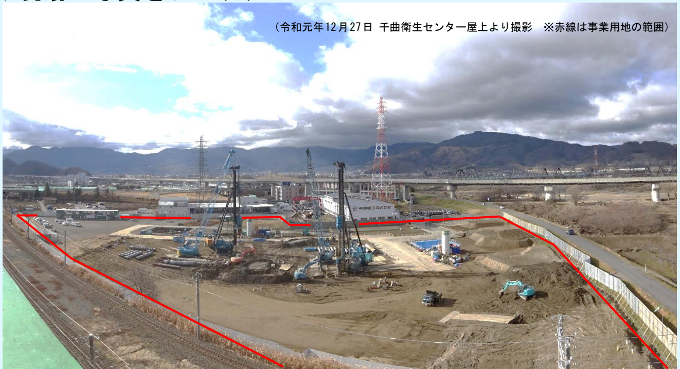
(令和元年12月27日 千曲衛生センター屋上より撮影 ※赤線は事業用地の範囲)