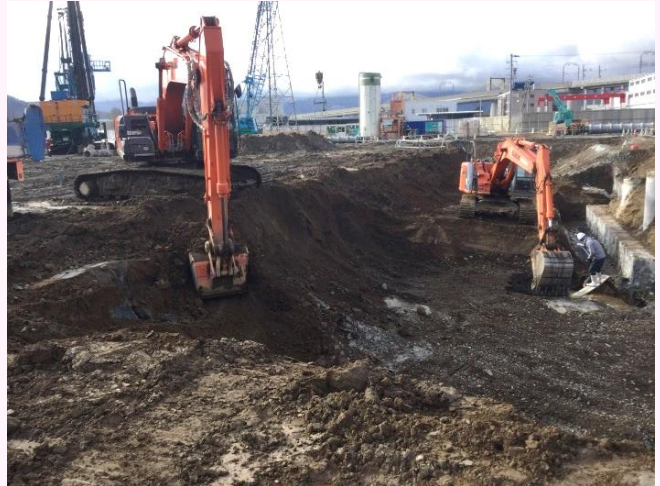
[山留工事を施工した箇所に沿って、地面を掘り進めていきます]