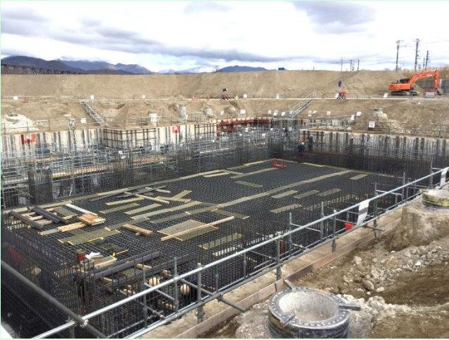
[鉄筋を組立てます]