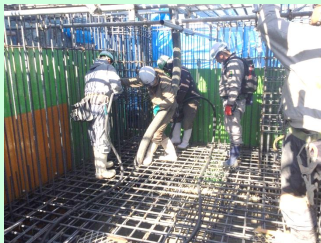
[コンクリートを流し込みます]

3月も引き続き、地下掘削工事及び地下基礎工事等を行います。皆様には御迷惑をお掛けいたしますが、安全に、周辺環境に配慮して作業を行って参りますので、御理解、御協力いただきますようお願いいたします。