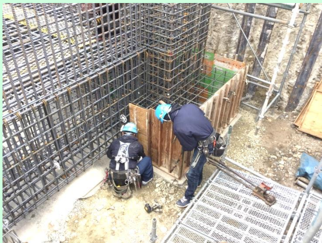
[型枠を設置します]