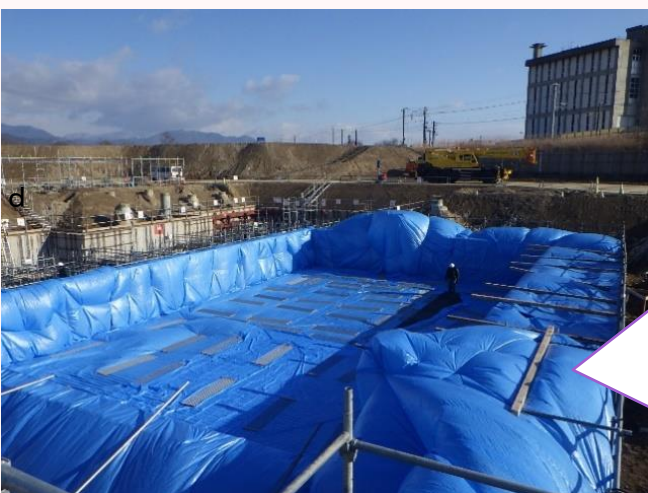
[コンクリートの養生を行います]