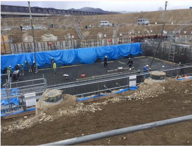
[コンクリートを流し込みます]