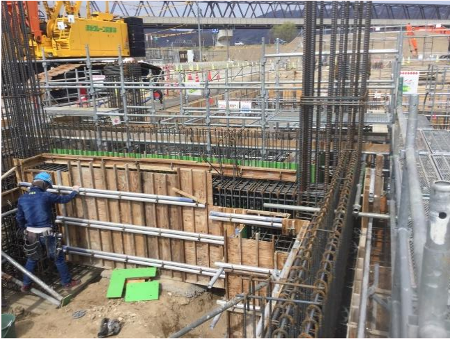
[鉄筋の周囲に型枠を設置します]