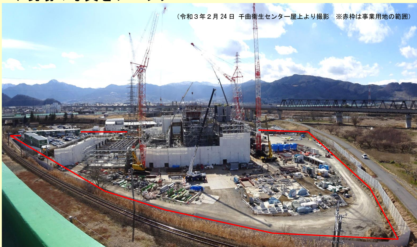
(令和3年2月24日 千曲衛生センター屋上より撮影 ※赤枠は事業用地の範囲)