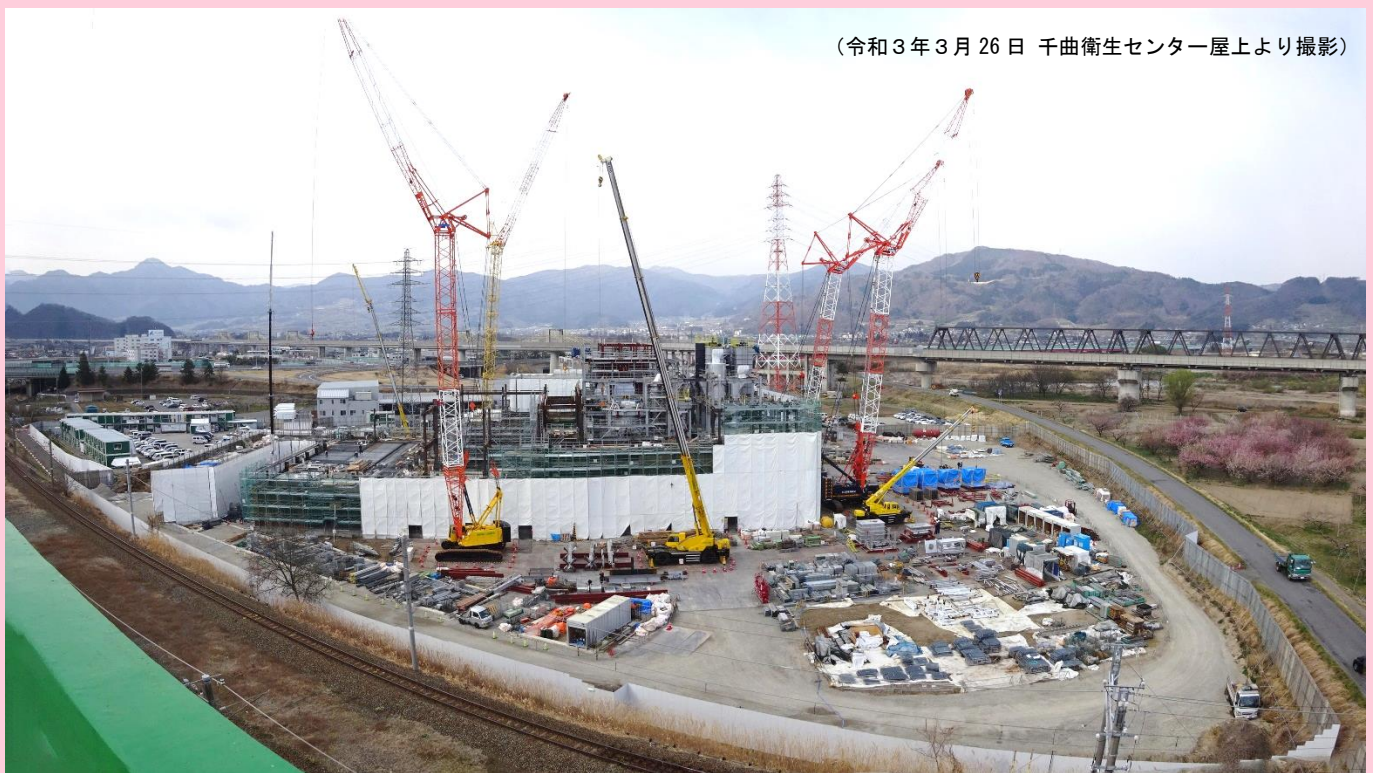
(令和3年3月26日 千曲衛生センター屋上より撮影)