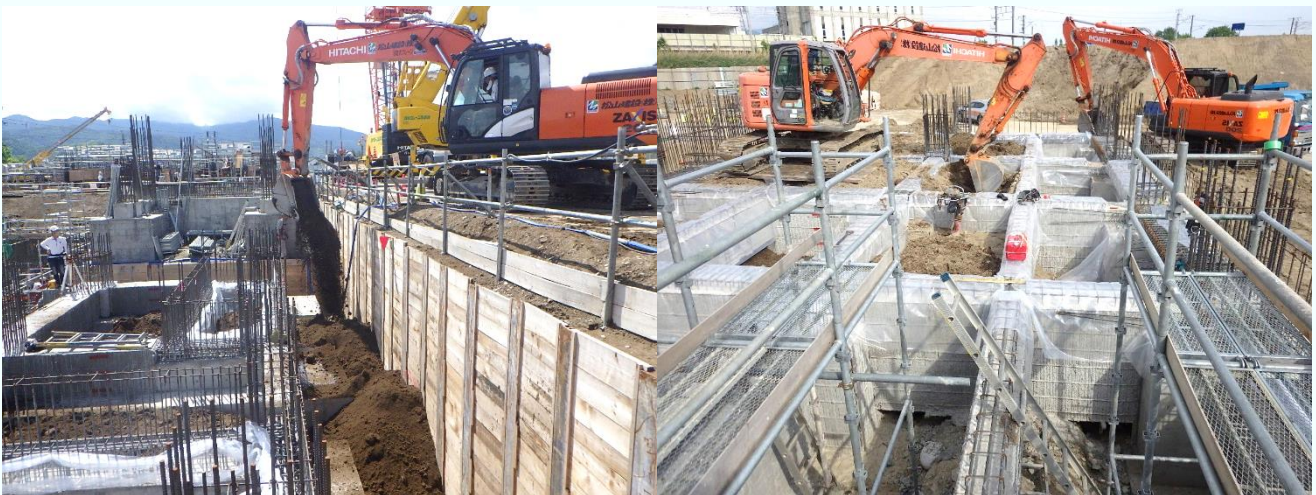
[一部、埋戻しを行っています]