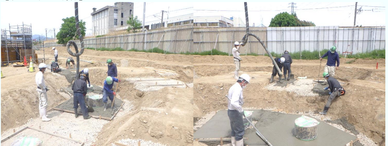
[捨てコンクリートを打設しています]

6月も引続き、基礎工事等を行います。皆様には御迷惑をお掛けいたしますが、安全に、周辺環境に配慮して作業を行って参りますので、御理解、御協力いただきますようお願いいたします。