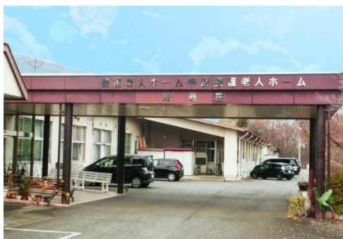
【高齢者福祉施設管理運営事業】