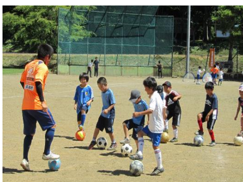
【スポーツ振興事業】