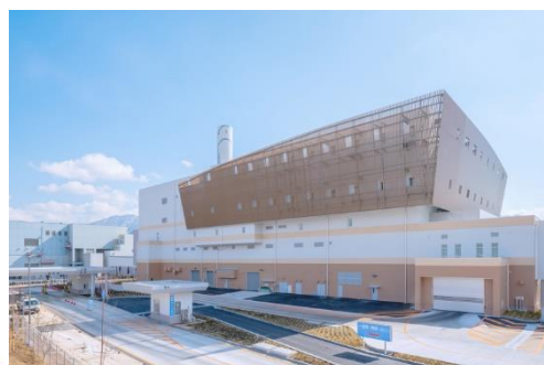
【広域のごみ処理事業】