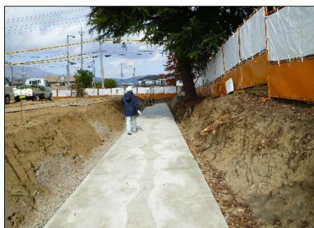
写真左：基礎コンクリート打設後

進捗に伴う工事エリア拡大のため、敷地東側の樹木伐採、プレキャストL型擁壁設置および仮囲い盛替を行います。基礎砕石、基礎コンクリート打設後、L型擁壁を設置していきます。