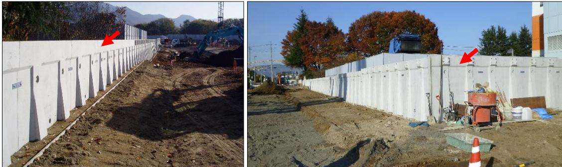
写真左：北側から見た敷地東側に設置したL型擁壁 写真右：南側から見た敷地東側に設置したL型擁壁

新施設は浸水対策として地盤高さを既存地盤から2m上げるため、盛り土を行います。東面に設置するL型擁壁はその土留めのために用いられ、単品高さは0.75～3mあり、121基設置する計画です。