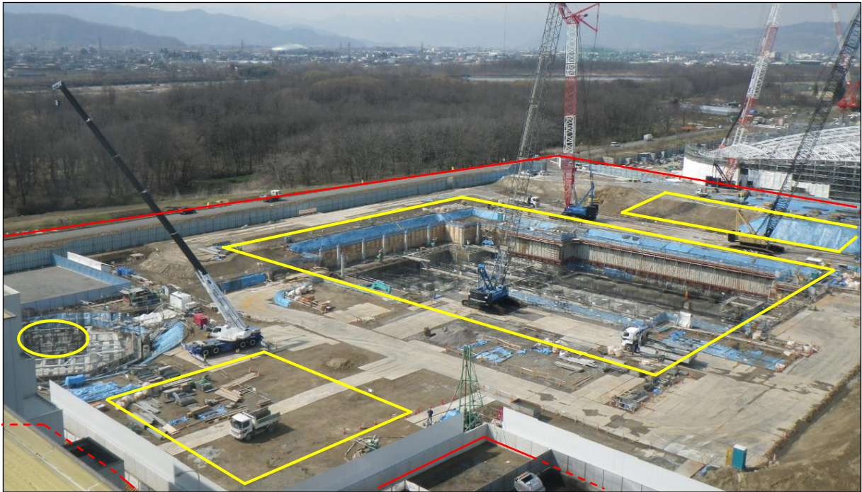
赤枠：工事範囲 黄枠：建設範囲（右から管理棟、工場棟、スラグストックヤード棟、煙突） 長野市清掃センター煙突から撮影