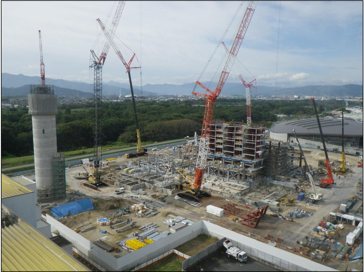
長野市清掃センター煙突から撮影