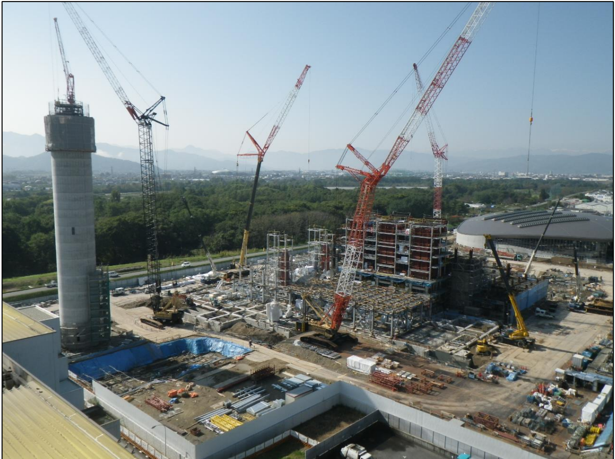
長野市清掃センター煙突から撮影