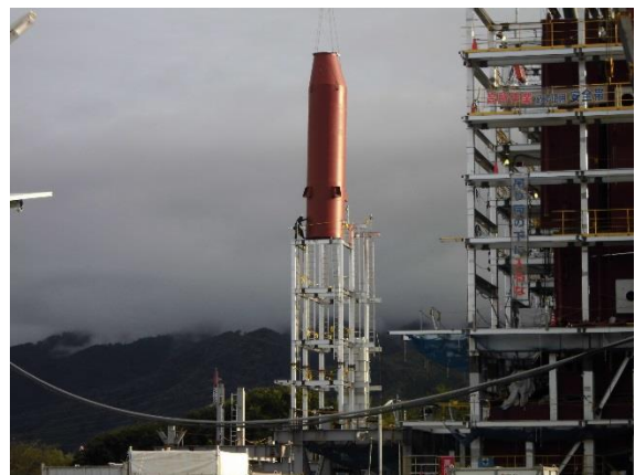
撮影④ 溶融炉排ガスを冷却する溶融減温塔の取り込み状況。