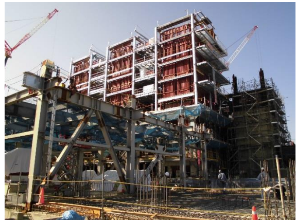
撮影② 工場棟北東側より、進捗状況。