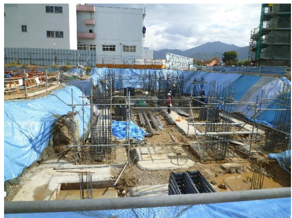
撮影③ スラグストックヤード棟の基礎工事を開始しました。