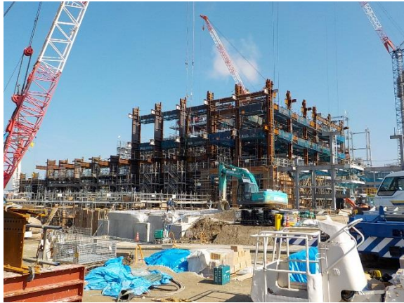
撮影① 工場棟南西側より、進捗状況。