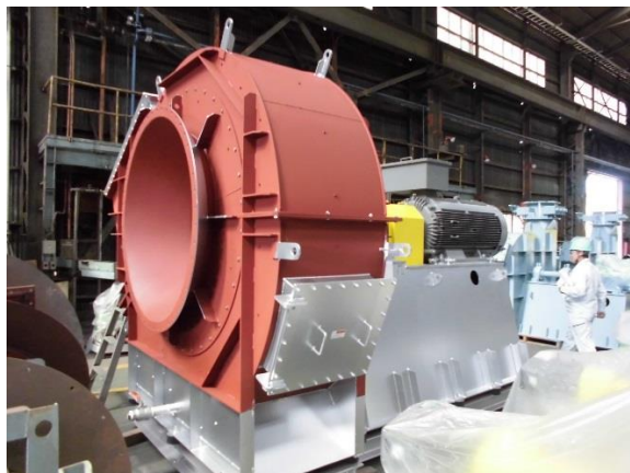
工場検査 焼却により発生するガスを排出する誘引通風機です。機器高さはおよそ3mです。