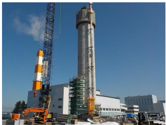
撮影⑤ 煙突撮影状況。現状地盤面から54mの高さです。