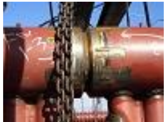
ボイラ水管溶接部

水を通す配管は開先を取り、溶接を何層も重ね、接続します。(写真は溶接途中のもの)