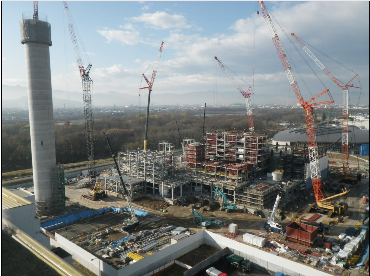
長野市清掃センター煙突から撮影