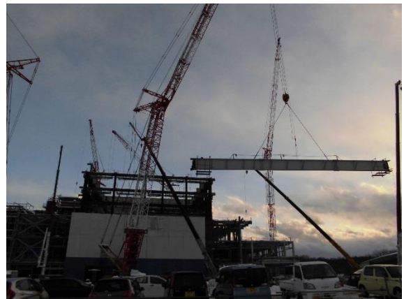
工場棟北側より撮影 約32mの屋上階の梁を取り込みます。設置時に水平になるよう、アーチ状に組んでいます。