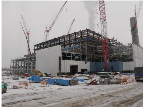
撮影① 工場棟南西側より、進捗状況。