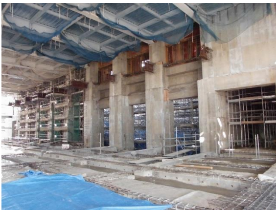
撮影④ プラットフォーム進捗状況。各開口からごみをピットへ投入します。