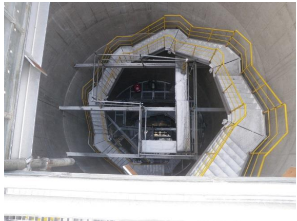
煙突上部より撮影 煙突内の階段は、クレーンで吊り上げ、上部から下部へ向かい設置していきます。