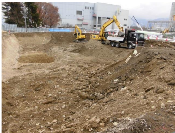
撮影③ 北側緩衝緑地、雨水の浸透貯留施設を設置する部分の進捗状況です。