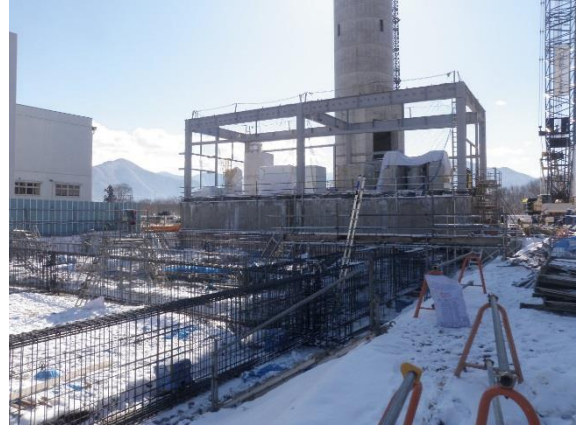
撮影② S S Y棟 奥の建屋には非常用発電機、特高受変電設備等が設置されています。