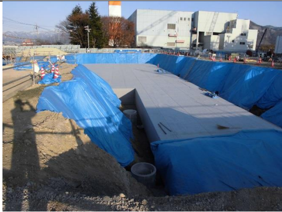
撮影① 北側緩衝緑地

発電機室へ納められる蒸気タービン発電設備の設置状況です。手前の深緑色の機械が発電機です。