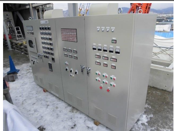
撮影③ 工場棟 2階

雨水の浸透貯留施設部分の進捗状況です。全面を透水シートで被い、その後に土を覆い被せま