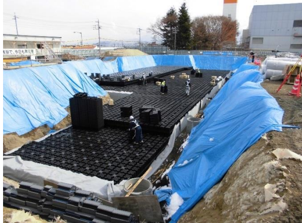
撮影① 北側緩衝緑地

雨水の浸透貯留施設部分の進捗状況です。プラスチック製貯留浸透槽を地下に設置しています。