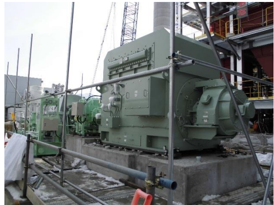
撮影③ 工場棟 2階

雨水の浸透貯留施設部分の進捗状況です。プラスチック製貯留浸透槽を地下に設置しています。