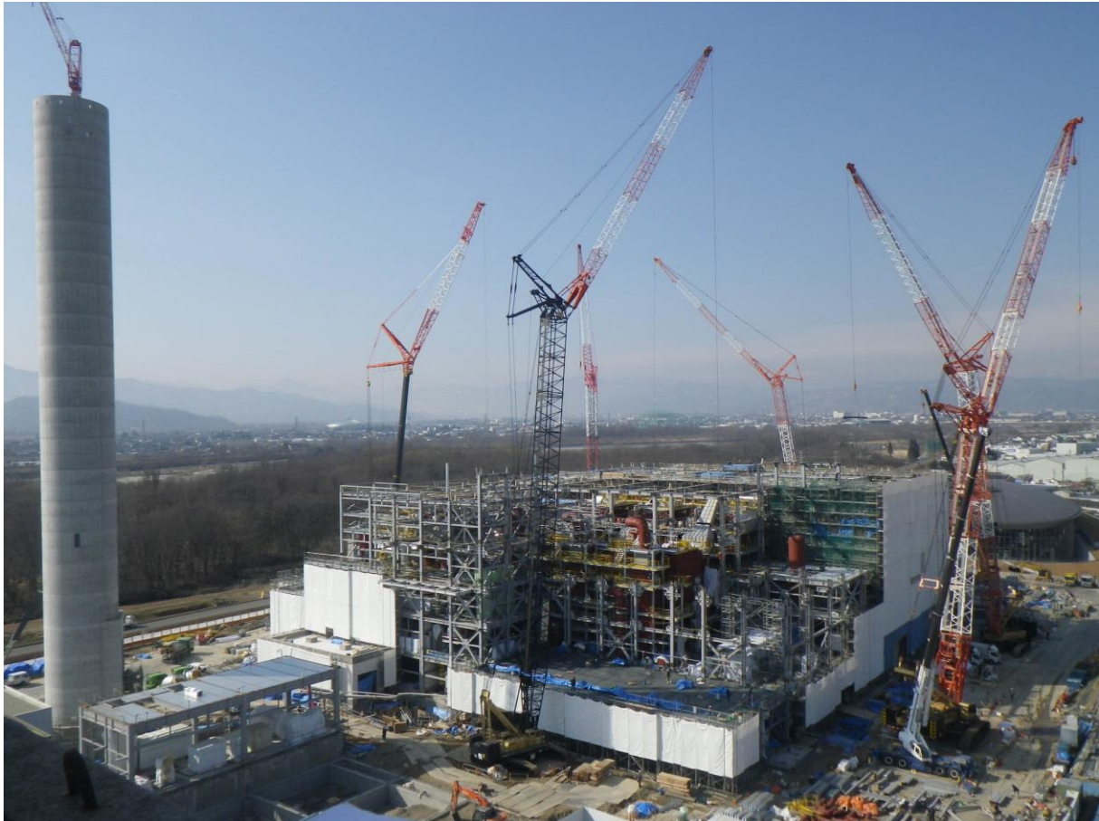
長野市清掃センター煙突から撮影