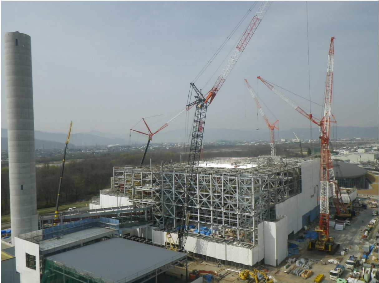
長野市清掃センター煙突から撮影