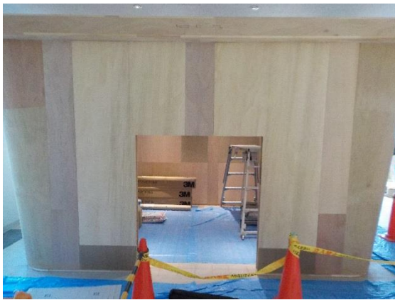
撮影② 情報発信設備

長野広域連合構成市町村の観光物産展示コー ナーです。各市町村毎に紹介を行う予定です。