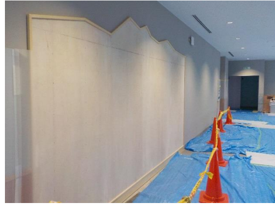
撮影③ 情報発信設備

ポリバケツ型の木組壁が立ち上がりました。 この中では、ながの環境エネルギーセンターの 「たんけん」をテーマに環境学習ができます。