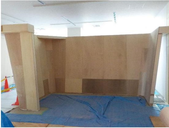
撮影① 情報発信設備

ポリバケツ型の木組壁が立ち上がりました。 この中では、ながの環境エネルギーセンターの 「たんけん」をテーマに環境学習ができます。