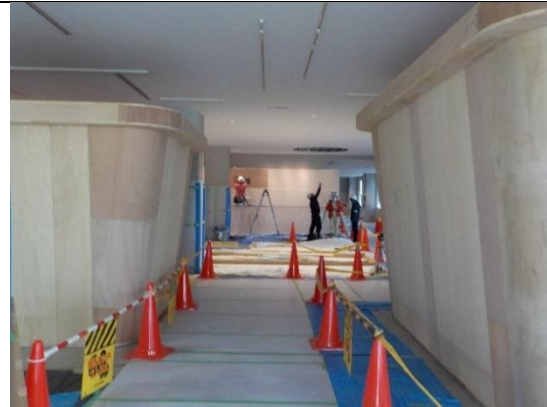
撮影④ 情報発信設備

ポリバケツ型の木組壁が立ち上がりました。 この中では、ながの環境エネルギーセンターの 「しくみ」をテーマに環境学習ができます。