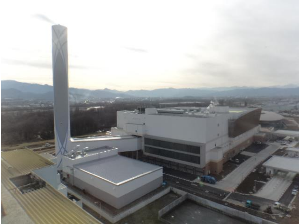
長野市清掃センター煙突から撮影