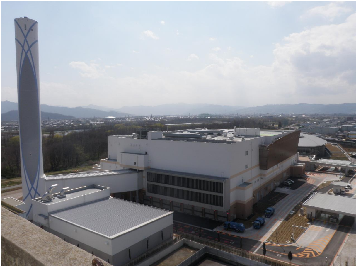
長野市清掃センター煙突から撮影