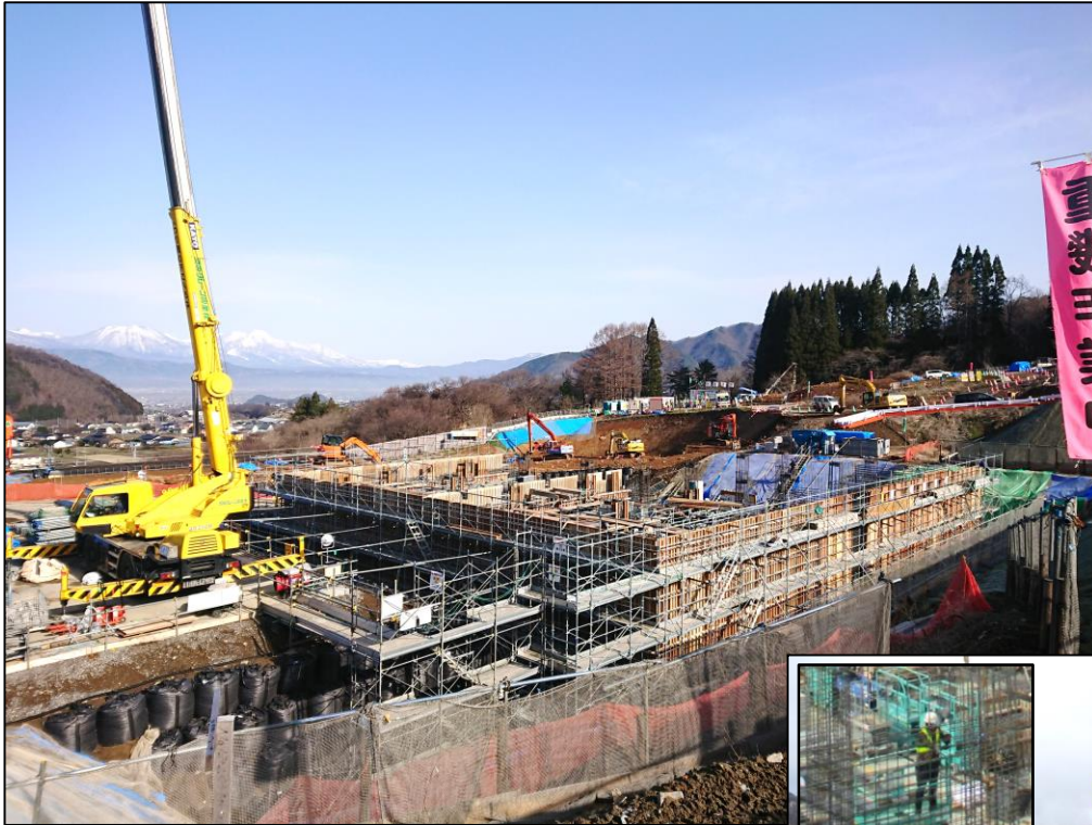
壁鉄筋吊り込み状況